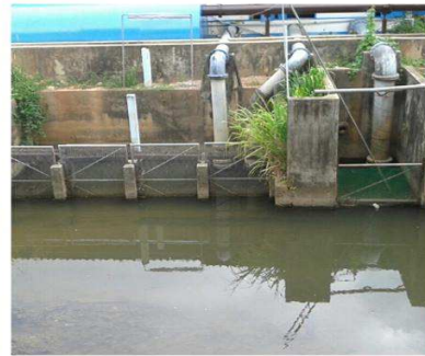
ภาพการก่อสร้างอ่างเก็บน้ำยะรม